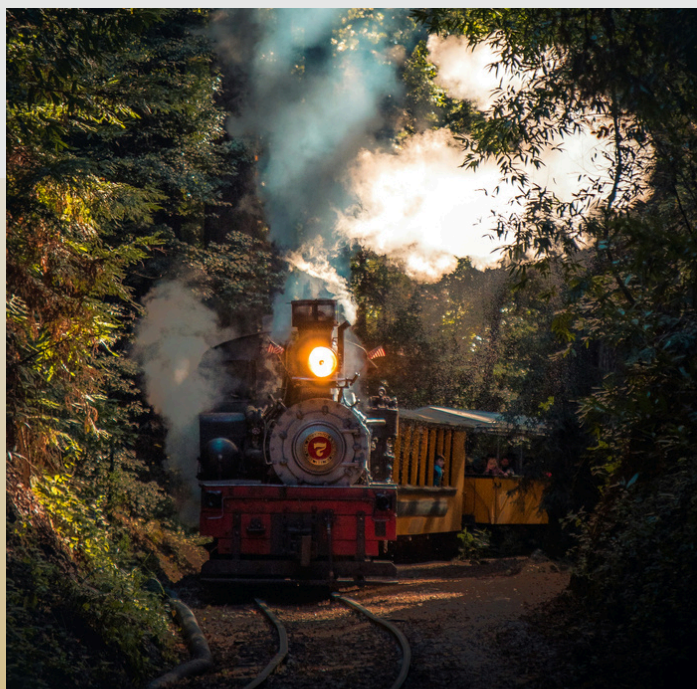
Trein naar Cold Spring